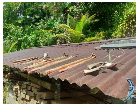
Gambar 4. Penjemuran Kimboleng Bahise

Proses penjemuran KB yang dilakukan oleh masyarakat Kampung Mahumu II belum menerepakan prinsip sanitasi dan hygiene karena ikan hanya di jemur diatas atap rumah sehingga ikan tersebut bisa terkontaminasi dengan kotoran dan bisa dihindangi lalat. Ikan hiu yang dijemur bisa menimbulkan bau menyengat karena daging ikan hiu mengandung urea antara 2,0 – 2,5 % dari total daging (Erungan et al, 2005). Menurut Dotulong, (2010) urea merupakan sumber ammonia yang menyebabkan bau dan rasa pesing pada daging ikan hiu. Cara sederhana untuk mengurangi urea pada daging ikan hiu yakni dengan larutan garam dan asam asetat (Berhimpon, 1982) dan dapat juga menggunakan larutan lemon cui (Dotulong, 2010). Penampakan penjemuran KB dapat dilihat pada Gambar 4.