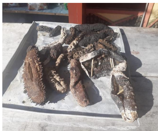
Gambar 5. Penjemuran Teripang

Pengeringan bertujuan untuk menghilangkan kadar air pada teripang hingga titik minimal sehingga teripang dapat disimpan dalam waktu lama. Jumlah kandungan air pada suatu produk akan mempengaruhi daya tahan bahan tersebut terhadap serangan mikroba (Adawiyah, 2007). Produk dengan kadar air tinggi rentan terhadap serangan mikroba sehingga lebih cepat mengalami kemunduran mutu (Herliany, 2011). Pengeringan teripang harus dilakukan hingga teripang berubah teksturnya menjadi keras seperti batu. Tekstur yang keras ini akan mencegah timbulnya jamur selama masa penyimpanan teripang kering (Purcell, 2014). Menurut Sasongko (2015), proses pengeringan dapat mempengaruhi berat produk akhir yang dihasilkan. Semakin kering produk, maka kandungan air yang ada pada produk semakin rendah sehingga beratnya juga semakin rendah. Hutomo (1997) dalam penelitiannya mengemukakan bahwa terjadi penurunan berat teripang kering sekitar 96% dari berat awal (teripang segar). Shelley (1985) menyatakan bahwa rasio berat segar dan berat teripang kering adalah 20 : 1, atau prosentase berat kering teripang hanya sebesar 5%. Penampakan teripang yang dijemur di Pulau Mahumu dapat dilihat pada Gambar 5.