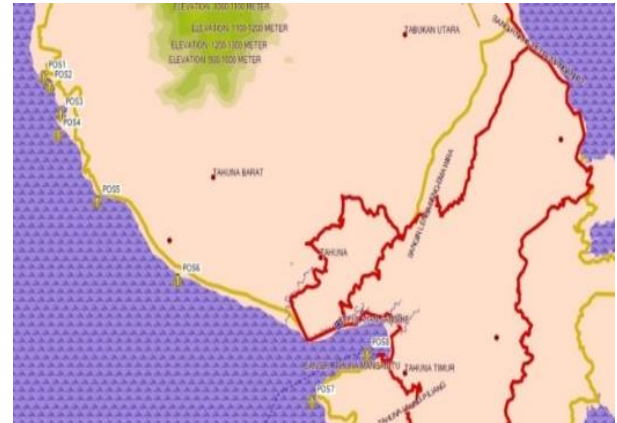
Gambar 3. Hasil Pembacaan Lokasi dengan menggunakan GPS

dengan Apeng Sembeka (Gambar 3), memberikan pengaruh terhadap hasil tangkapan nelayan.