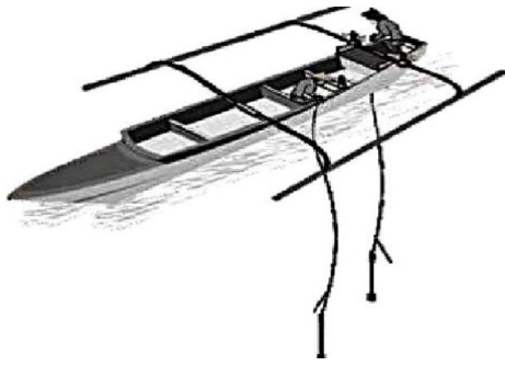
Gambar 2. Jenis perahu tipe pelang