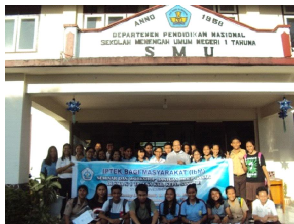
Gambar 1. Foto Bersama Instruktur dan Peserta

hari Sabtu, 12 November 2016 pukul 08.00 – 12.00 WITA. Tempat pelaksanaan kegiatan ini yaitu di Aula SMAN I Tahuna dengan jumlah peserta 30 orang siswa. Siswa-siswa yang menjadi peserta merupakan perwakilan dari 3 unit kegiatan siswa di sekolah yaitu: 10 orang dari SISPALA, 10 orang Pramuka, dan 10 orang PMR.