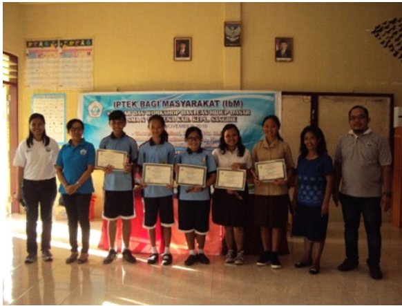
Gambar 2. Peserta Terbaik