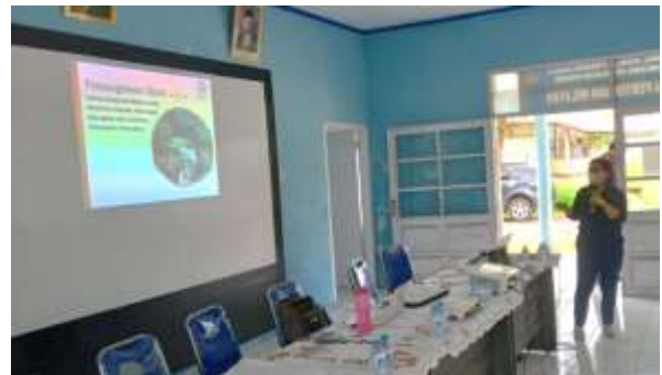
Gambar 4. Pemberian Materi Penerapan Sistem Rantai Dingin pada Ikan

Setelah tim memberikan materi pengantar kepada peserta tentang faktor yang dapat menjaga mutu ikan hasil tangkapan. Selanjutnya, peserta akan diberikan pemahaman tentang “pentingnya menerapkan sistem rantai dingin pada ikan hasil tangkapan”, seperti ditunjukkan pada Gambar 4. Tim PKMS menyampaikan bahwa untuk menjaga kualitas ikan hasil tangkapan, nelayan harus menangani ikan dengan benar. Salah satu cara penanganan ikan hasil tangkapan yang benar, yaitu dengan menerapkan sistem rantai dingin. Sistem rantai dingin, yaitu sebuah sistem suhu rendah yang menjamin proses penangkapan ikan di laut, proses pengolahan, proses distribusi produk ikan sampai ke konsumen, yang menjamin kualitas ikan tetap baik dan aman untuk dikonsumsi (Lailossa, 2009).