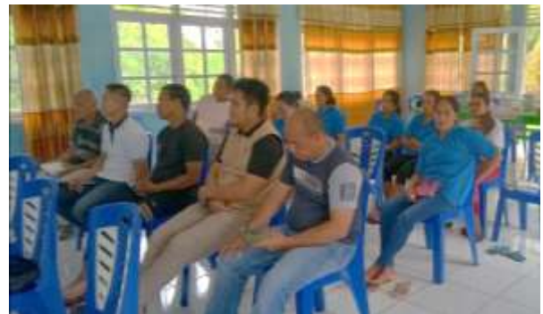
Gambar 1. Peserta Penyuluhan Penerapan Sistem Rantai Dingin di Pelabuhan Perikanan Perintis, Dagho

Kegiatan program kemitraan masyarakat stimulus tentang pentingnya penerapan sistim rantai dingin pada ikan hasil tangkapan dilaksanakan pada tanggal 17 September 2022 di Balai Pertemuan Pelabuhan Perikanan Perintis Dagho, Kabupaten Kepulauan Sangihe, Sulawesi Utara. Peserta penyuluhan yang hadir, yaitu nelayan mitra dan karyawan PT. Perikanan Indonesia unit Daho dan PT. Jassendo Sentosa Mandiri, Dagho berjumlah 15 orang (Gambar 1).