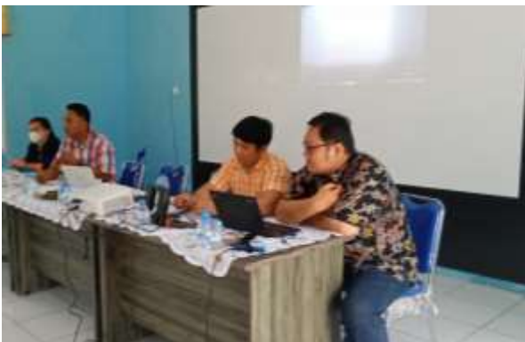
Gambar 3. Pemberian Materi Faktor Penyebab Kemunduran Mutu Ikan

Penyajian materi pendahuluan tentang “Faktor yang Mempengaruhi Kemunduran Mutu Ikan” yang disampaikan oleh tim PKMS seperti ditunjukkan pada Gambar 3. Ikan segar hasil tangkapan memiliki kelemahan, yaitu sangat mudah mengalami kemunduran mutu atau kerusakan ( highly perishable food ) (Lemae dan Lasmi, 2019). Kemunduran mutu pada ikan hasil tangkapan terutama disebabkan karena adanya aktivitas enzim, aktivitas bakteri, dan aktivitas kimiawi, yang ada dalam tubuh ikan (Ndahawali, 2016). Ikan akan terus mengalami kemunduran mutu jika tidak dihambat.