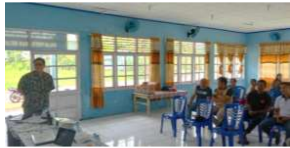
Gambar 5. Pemberian Materi Pentingnya Sanitasi dan Hygiene pada Proses Penanganan Ikan

Pratama et al. (2017) menyatakan sanitasi merupakan tindakan pengamanan untuk mencegah penyakit. Sanitasi dapat dilakukan dengan memperhatikan kondisi fisik seperti peralatan, tenaga kerja dan lingkungan. Sedangkan hygiene merupakan suatu tindakan pencegahan penyakit dan pemeliharaan kesehatan, yang meliputi bahan utama dan bahan tambahan yang digunakan yang tidak membahayakan kesehatan, serta peralatan yang digunakan (Adawyah, 2014).