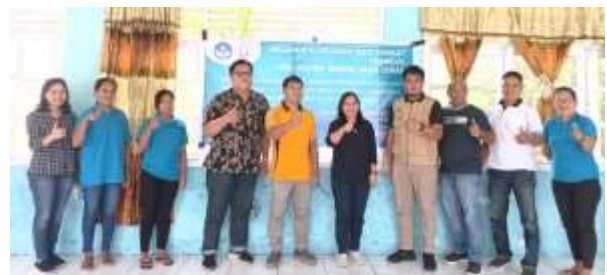
Gambar 7. Foto Bersama dengan Peserta Penyuluhan

Setelah itu dilakukan penutupan dari kegiatan Program Kemitraan Masyarakat Stimulus oleh Kepala Pelabuhan Perikanan Perintis Dagho, yang menekankan sangat perlunya sinergitas dari pemerintah, stakeholder (dalam hal ini pihak perusahaan) dan akademisi untuk memberikan pengetahuan dan pemahaman kepada para nelayan dan pekerja khususnya yang beraktivitas di Pelabuhan Perikanan Perintis Dagho. Kegiatan penutup juga dilengkapi dengan foto bersama (Gambar 7).